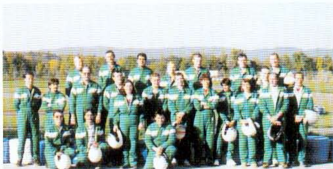
Le renouvellement du certificat AFAQ a été fêté par un séminaire karting dans une chaleureuse ambiance.

Dans la mesure où le produit poteau de clôture est un produit conçu par nous, nous avons intégré à notre système la conception et le développement. La manière de procéder à cette conception a été retranscrite dans une procédure et la bonne application des règles définies est démontrée à travers